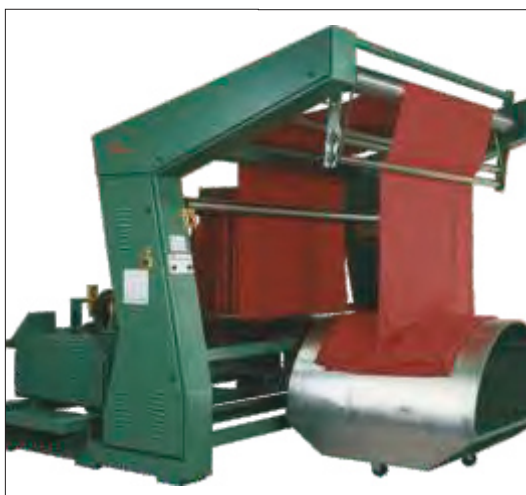
Formazione falda - Plaited

Due to the special desing of the unwinder and the trucks, the fabric is plated down and deposited in the truck in a perfect way to allow draining of the water for a continuous perfect fabric introduction into the stenter frame. Special technical design features of the LM88 unwinder make it particularly suitable for use with a large variety of fabrics.